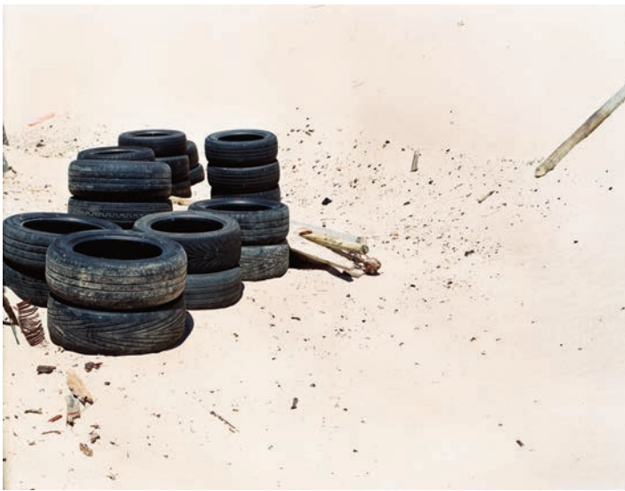
José Pedro Cortes: Sen título #23 da serie Costa, 2013

Vivimos tempos paradoxais: moitos prevían que o libro, como obxecto físico, estaría condenado a un agonizante fin na súa batalla contra a dixitalización masiva dos contidos. En verdade, moitas foron as editoriais de todas as áreas do coñecemento humano, da literatura ás ciencias exactas, do entretemento á filosofía, que tiveron que fechar as portas os últimos anos. Asistimos, igualmente, a un continuo pechamento de librarías, tanto xeralistas coma especializadas. Non obstante, ao longo da última década, puidemos inferir que un movemento subterráneo acompañaba ese declive: pequenos editores comezan a despuntar nun contexto de crise, o que denota unha actitude de voluntarismo case heroico comparable aos movementos editoriais máis alternativos e conceptuais dos anos sesenta e setenta do século pasado, nos cales a idea de edición de autor e libro de artista se promoven como alternativa a un mercado da arte cada vez máis agresivo e como espazo de reflexión e experimentación esencial para voces que se querían facer notar en circuitos paralelos á pura especulación economicista que se produce arredor da arte.