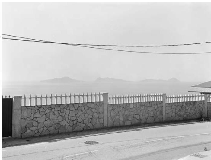
Luis Díaz Díaz: Sen título da serie Cies . Primeira aproximación, 2015

historic republications of the classic Lisboa, cidade triste e alegre , by Victor Palla and Costa Martins. The other Portuguese publishing house, Ghost, was founded by the photographer Patrícia Almeida (Lisboa, 1970) and David-Alexandre Guénio (Caen, France, 1972), a cultural producer. As part of a production media diversification strategy, it invests not only in photography books but also in different media, of which, worthy of mention in this exhibition is the project Souvenirs from Europe , in which artists residing in Europe reinterpret the possibility of politicised art through posters.