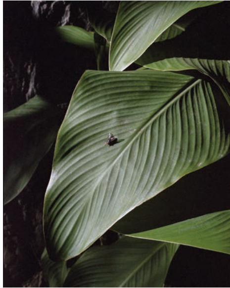
Tono Mejuto: Da serie Unidad vecinal , 2014