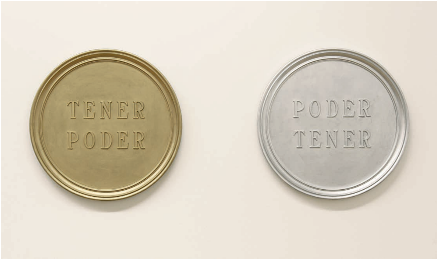
Yolanda Herranz: Tener poder. Poder tener. Proxecto Tomar la palabra , 1996. Colección CGAC

co fin de investigar coa apropiación de imaxes e coas posibilidades escultóricas e instalativas dun medio que é bidimensional. Ademais a súa obra estivo moi pendente de como a imaxe organiza o espazo e se relaciona con el: tanto nas súas obras como nas súas instalacións utilizou a proxección e a transparencia.