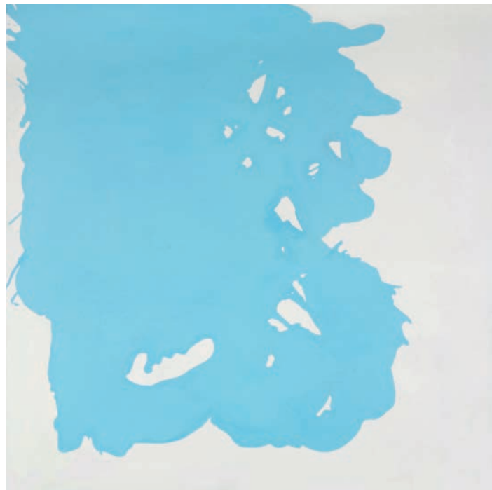
Berta Cáccamo: Verquido no. 23 , 2007. Colección Deputación da Coruña. © Berta Cáccamo, VEGAP, Santiago de Compostela, 2016

M.M.: And when you speak of affectivity, of affection, could you explain that a bit more? Because when looking at your paintings one sees an economy of expressive means, a notable restraint in gesture, an economy of gesture and a very personal palette. There is also a very unique relationship with the format, a treatment of the painting with liquidity, with the blemishes. You create a protocol and develop a process that involves a certain distance, you place and prepare all the elements that you are going to manage. If so, how then does affectivity intervene?