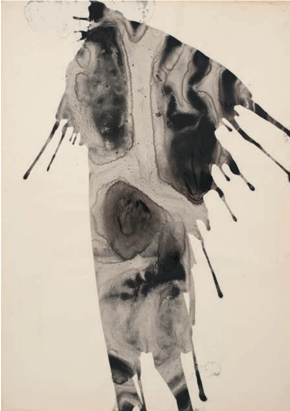
Berta Cáccamo: Sen título , 2004.

© Berta Cáccamo, VEGAP, Santiago de Compostela, 2016