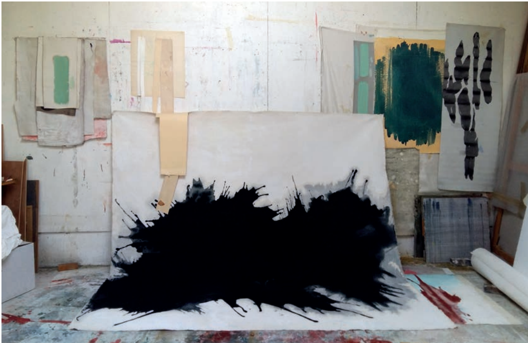
Fotografía do estudio da artista, Vigo, 2016.

sumamos unha terceira opción na que a artista espera a que se seque a mancha para repíntala con pincel, representando a propia pintura a partir dun xesto premeditado, medido e reproducido en varias capas, entón ao acto de pintar sumarémolle a posición e actitude da artista, que reflexiona e conceptualiza a pintura para, en certo modo, converter en figurativo o abstracto. Dito con outras palabras, sería algo así como pintar a pintura, aínda que o que se oculta, o que o proceso enmascara, resulta tamén fundamental.