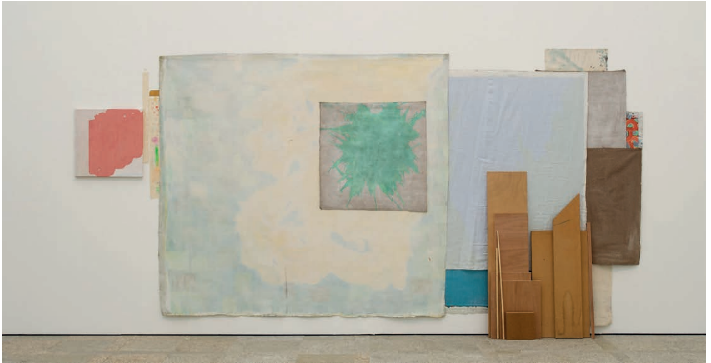
Berta Cáccamo: Pièce unique , 2012. © Berta Cáccamo, VEGAP, Santiago de Compostela, 2016

exposición: malia o carácter retrospectivo da selección ser evidente, non se trata dunha retrospectiva ao uso, unha vez que se ofrece desordenada en tempos, formatos e estilos co fin de evidenciar o presente continuo da súa pintura, o circular das súas obsesións, a insistencia dos seus motivos e a convivencia do conceptual e o afectivo. Tamén porque deixa un espazo para o azar, para a construción serendípica e para reconstrución de imaxes pasadas. Se a pintura abstracta se fabricou a si mesma e foi quen de se construír a partir da súa propia realidade fenomenolóxica, así tamén a traxectoria artística de Berta Cáccamo, e en complicidade con ambas as derivas, esta mostra configúrase seguindo esas mesmas premisas.