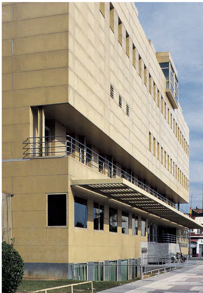
Alejandro de la Sota: edificio de Correos y Telecomunicaciones. León, 1981-1984.