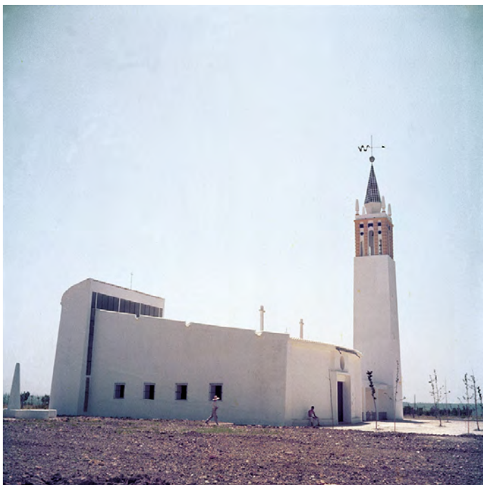
Alejandro de la Sota: pueblo de Esquivel. Sevilla, 1952-1963.

4. Curiosamente, e en paralelo á construción deste personaxe aparentemente apartado do ambiente arquitectónico nacional, Alejandro de la Sota segue sendo a día de hoxe o arquitecto moderno español máis extensamente e mellor publicado. Non obstante, a pesar de que cada vez se coñece máis do personaxe e da súa obra, Alejandro de la Sota segue conservando o seu carisma. Á súa figura mítica de arquitecto cunha firme posición ética ante a profesión e un discurso lóxico e directo úneselle unha das traxectorias máis intensas e coherentes da historia recente da arquitectura española. A pesar de que as nosas circunstancias non son as súas, o seu legado continúa estando aí, listo para facer uso del. Calquera lectura que fagamos hoxe da súa obra debería pasar obrigatoriamente pola súa actualización, quizais pola súa desmitificación tamén, por facer noso o seu xeito tan singular de facer esa arquitectura que, como el sostiña, debería de escribirse cun a minúscula .