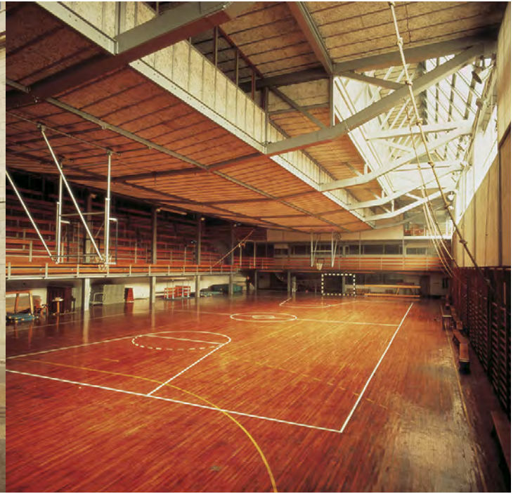
Alejandro de la Sota: ximnasio do colexio Maravillas. Madrid, 1960-1962.

unha arquitectura física en contraposición a unha química, na que ningún elemento se mestura con outro para producir un terceiro, senón que, coas pinzas, sempre poidas dar con toda a personalidade do elemento”.