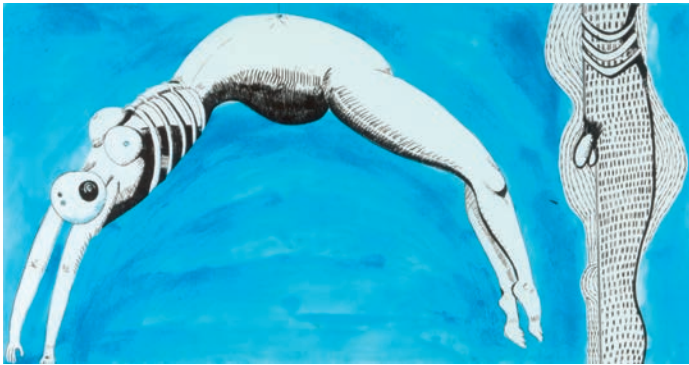
Louise Bourgeois: Triptych for the Red Room , 1993. Colección de la Junta de Andalucía - Centro Andaluz de Arte Contemporáneo.

asumen, y la sutil prestancia de unas figuras siempre verticales, de madera teñida en oscuro o con breves toques de blanco o negro, y más breves aún de rojo o azul.