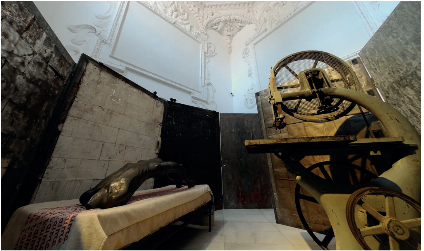
Louise Bourgeois: Cell (Arch of Hysteria), 1992-1993. Colección de la Junta de Andalucía - Centro Andaluz de Arte Contemporáneo.

entre o exercicio de recordar e a necesidade de esquecer. Non se trata de meras citas independentes, senón da crónica dun tempo que deixou na mente unha profunda pegada e que precisa ser mostrado [...] en grupo, ambientado espacialmente, case arquitectonicamente, mostrando a base do que andando o tempo serían as rotundas instalacións de Bourgeois.