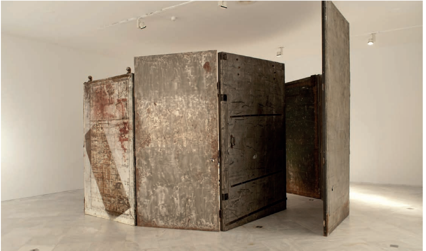
Louise Bourgeois: Cell (Arch of Hysteria), 1992-1993. Colección de la Junta de Andalucía - Centro Andaluz de Arte Contemporáneo.

familiar ampliouse a un taller de restauración de tapices, cando tiña oito anos, Louise comezou a debuxar aqueles fragmentos do labor que se perderon, iniciando o que pode considerarse como unha orientación ao mundo da creación artística.