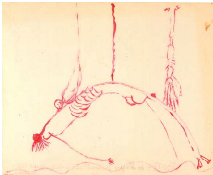
Louise Bourgeois: Untitled , 1992. Colección de la Junta de Andalucía - Centro Andaluz de Arte Contemporáneo. © The Easton Foundation / VEGAP, Santiago de Compostela, 2016