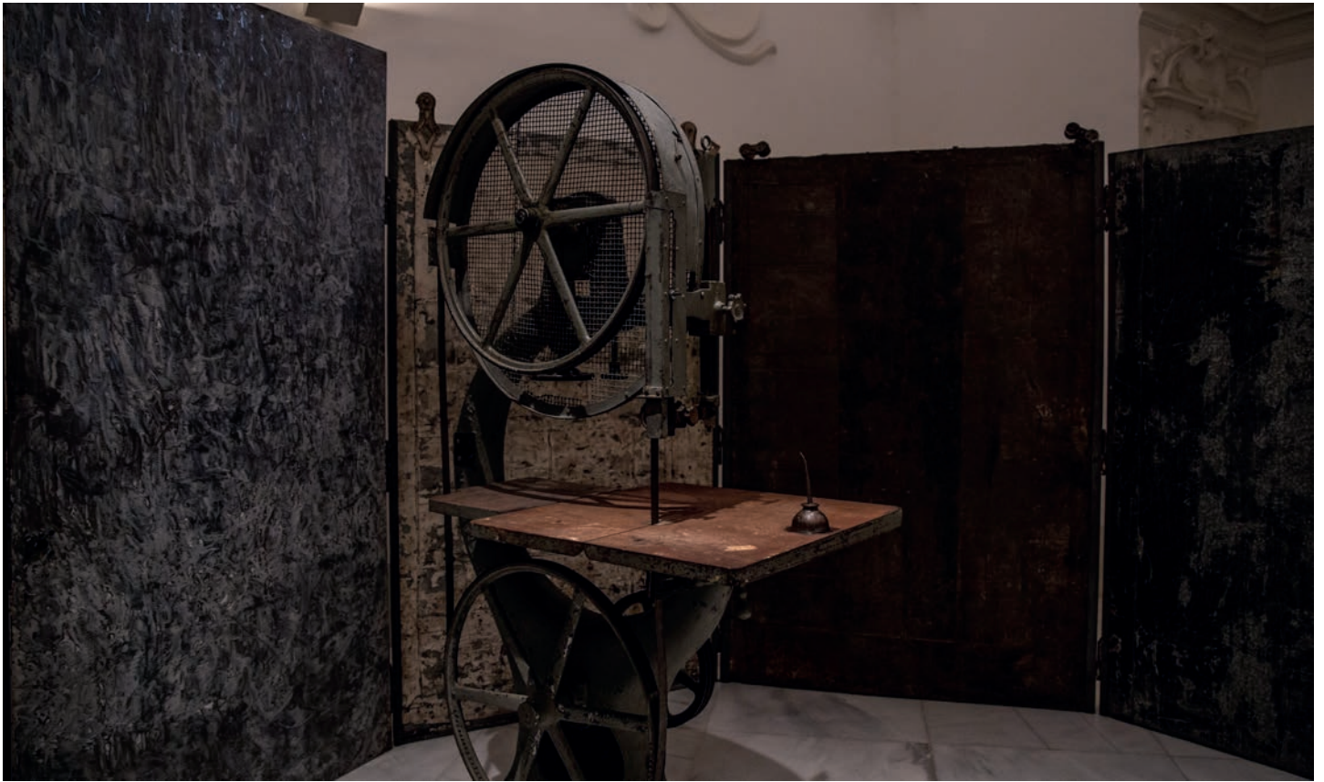
Louise Bourgeois: Cell (Arch of Hysteria), 1992-1993. Colección de la Junta de Andalucía - Centro Andaluz de Arte Contemporáneo.

like Brancusi and primitive Cycladic sculptures—modernity and classicism in perfect harmony—but also of the adventure in the process of visualising what memory and conscience keep so alive in such an abstract creation. These characters were somehow the portraits of people that Bourgeois had left back in France and, despite their undefined physique, they were personalised by a series of subtle attributes, which were ultimately part of a code that she could only decipher.