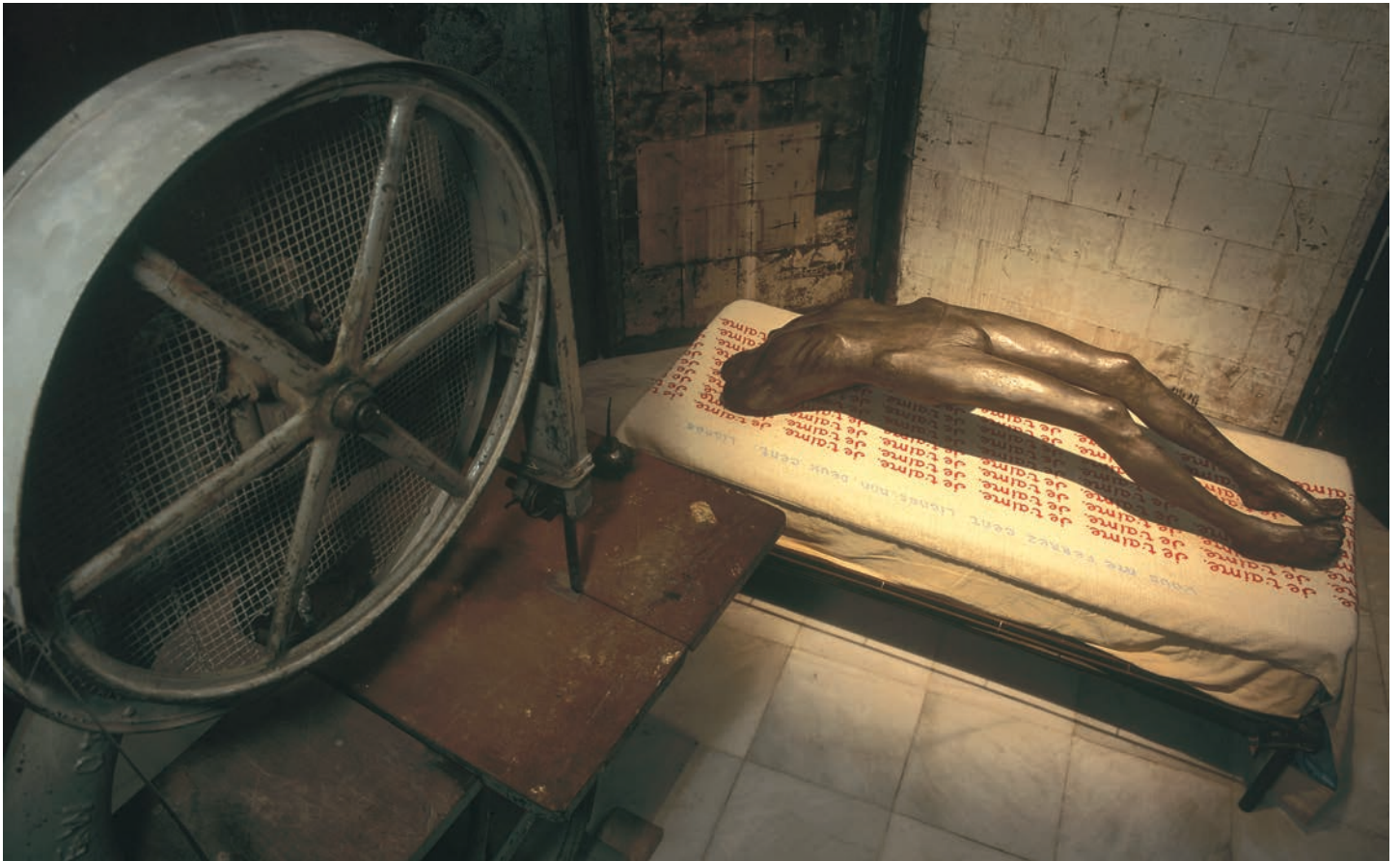
Louise Bourgeois: Cell (Arch of Hysteria), 1992-1993. Colección de la Junta de Andalucía - Centro Andaluz de Arte Contemporáneo.

to the emotional need of manifesting herself—of notes that reaffirm and deny facts. Among the emblems that appear in the nineteen-sixties are those of 'germination' and sex, women and life's attributes, the sense of evolution, the reason of being, that almost secret role of feminism—hers is a very peculiar and mediated feminism—, which she claims from nostalgia and a dramatic existence. All of these symbols are presented together with those of masculinity in a parallel fashion or in blatant discrepancy.