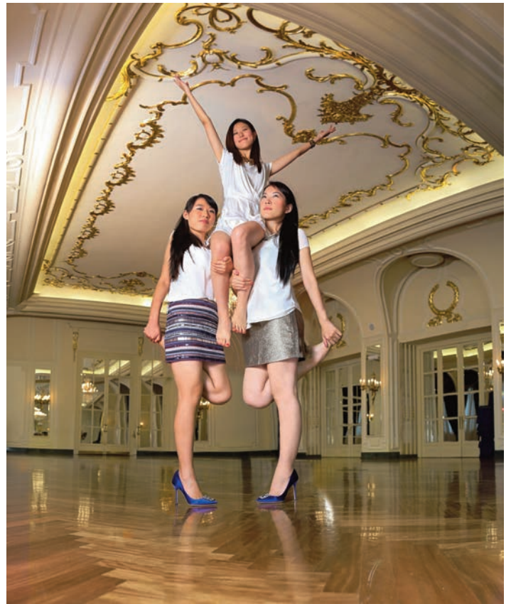
Cristina Lucas: Superbién común. Manolos , 2014

As fotografías de El superbién común preséntanse no mesmo formato que os millóns de anuncios publicitarios que inundan as nosas rúas e conseguen espertar no espectador unha primeira reacción de desexo —a través de cores vistosos e sorrisos enlatados— que se transforma aos poucos segundos en incomodidade ante a comprensión de que se trata dunha corrosiva crítica ao noso consumismo exacerbado e individualista.