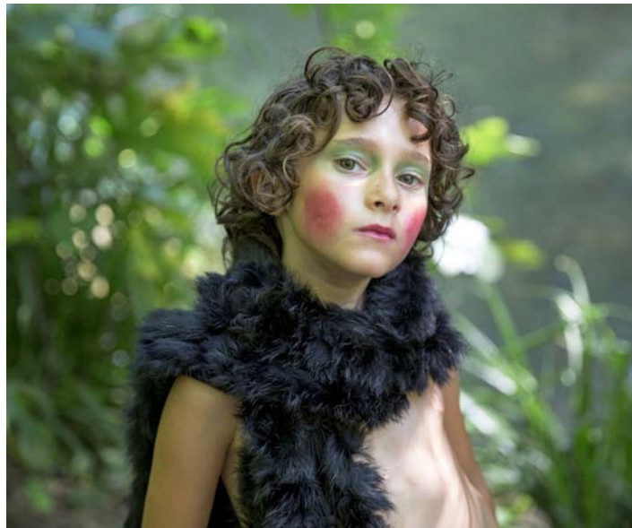
Carla Simón: Verán 1993, 2017

Suele pensarse la utopía como una quimera, como una proyección irrealizable desde un presente oscuro hacia algún futuro, mejor pero también inalcanzable. El término fue acuñado por Tomás Moro en 1516 en su obra homónima a partir —en una de las interpretaciones posibles— de los vocablos griegos ou (que expresa negación) y tópos (lugar): es decir, nowhere , en su primera traducción inglesa, o no hay tal lugar , como un siglo más tarde Francisco de Quevedo lo trasladó al castellano.