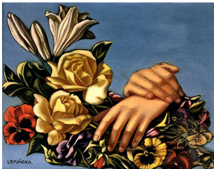
Tamara de Lempicka: Mans e flores , ca. 1949

Frida Kahlo (1907-1954), co seu estilo totalmente persoal, segue inspirando e influíndo o mundo da moda, os medios e a arte. Ao observar os seus retratos pódese constatar que Kahlo comprendeu a importancia da imaxe e da actitude, moito antes de que estas palabras formasen parte do vocabulario do marketing do noso tempo. Para ela, a vida era teatro e a roupa, o seu vestiario de escena, xa se tratase