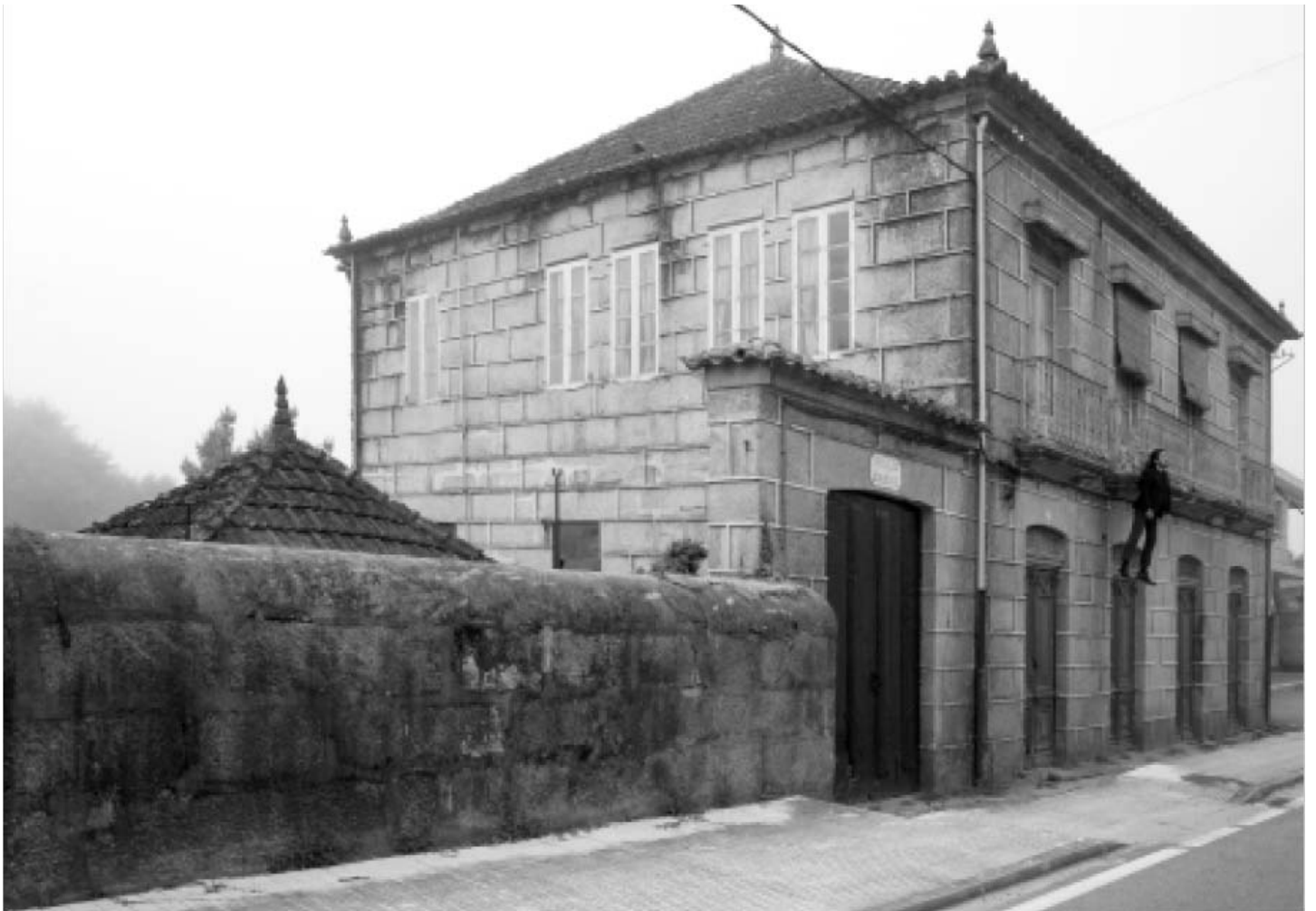
Rodríguez-Méndez: Casas gallegas , 2008. Colección CGAC. Sección CGAC-Xacobeo

En la serie Himno la música y el texto, junto a la reapropiación, se asientan como mecanismos desde los que abordar, o quebrantar, los múltiples binomios que se establecen en torno a la idea de identidad comunitaria. Emplea, para ello, la música que Pascual Veiga compuso para el himno gallego planteando diferentes modificaciones, interpretaciones alteradas que ya no abrazan el lugar común sino que encierran lo sarcástico. Los músicos se interrumpen, se molestan, el himno se desvirtúa mientras intenta prosperar un afán por perpetuarlo. Juan López desplaza el himno del espacio del mito, lanzando interrogantes hacia un mundo que quiere redimirse en la cohesión pero que sabemos heterogéneo.