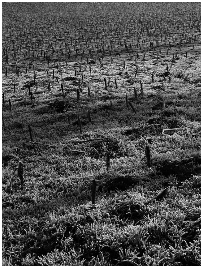
Raniero Fernández: Un millón de mortos , A Sionlla, 1963

Ten rexistrados máis de catrocentos negativos de hórreos e realiza máis de catrocentas copias de estudio de 13 x 18 cm, o que dá unha idea da amplitude do traballo. Nel non emprega ningún tipo de recurso estetizante, de xeito que quedan reflectidas as súas diferentes morfoloxías e as demais características dos hórreos. Estas imaxes non son realizadas para mandar a concursos, nin responden á estética que caracteriza a fotografía dos afeccionados,