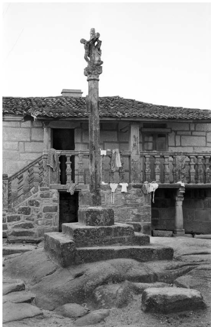
Raniero Fernández: Combarro, 1961

We believe that the best way to approach the meaning of these series is to show them in the form of polyptychs, one with 60 granaries and another with 42 stone crosses, regardless of whether some photographs are also presented individually and, given the importance that he attached to the way the archive is structured, we believe that it is essential to bring to the room elements that give an idea of his archival rigour. Moreover, this way of presenting the images is consistent with that which the associations habitually employed, albeit with a different intentionality.